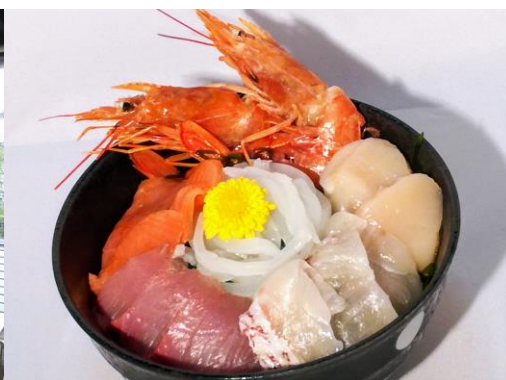
新鮮な海鮮丼が楽しめる新店舗「かびばら亭」

当施設は一つの節目である5周年目を迎え、さらに地域内外の多くの方にご利用いただき地域に賑わいを生み出せるよう、今後も施設の機能をパワーアップしていきます。