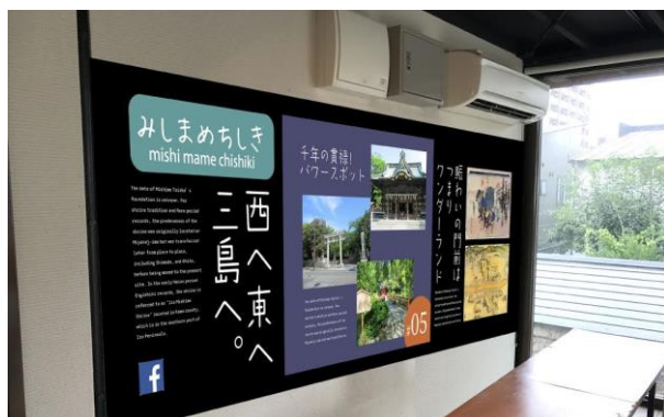
三島の歴史や文化を紹介！ 第一回は「三嶋大社」

なお、PON×POCO では、三島に大きな子育ての輪をつくっている「ママとね」と提携することで子育てに役立つ情報を提供したり、wai×wai! では、今後、子どもたちが考えたワークショップやイベントを開催し、子どもたちが自ら発信することで、たくさんの仲間が集まる場所をつくり出すことができるようサポートしていきます。